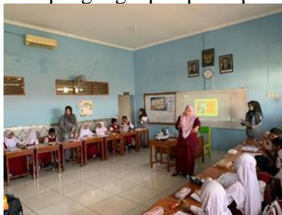
Gambar 1. Proses Pembelajaran

Aktivitas dan antusiasme elajar siswa penggunaan media E-flashcard digital menunjukkan perubahan signifikan pada aktivitas belajar siswa kelas IV. Hasil observasi mengungkap bahwa siswa menjadi lebih fokus, antusias, dan aktif dalam proses pembelajaran dibandingkan saat menggunakan media konvensional. Perhatian siswa secara langsung terarah pada visualisasi gambar dan kata kunci yang disajikan, sehingga suasana kelas menjadi lebih hidup dan interaktif. Selain itu, siswa terlibat aktif dalam diskusi, tanya jawab, serta pengungkapan pendapat mengenai isi media tersebut.