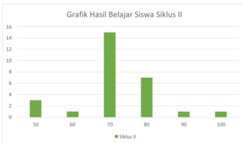
Gambar 4. Hasil belajar siklus II

Dapat dilihat dari data grafik dan tabel 3 dapat dilihat bahwa pencapaian nilai siswa sudah mengalami peningkatan yang cukup baik dan sudah optimal. Dari 28 siswa kelas I, tinggal 3 siswa (11%) yang belum tuntas dimana mereka mendapat nilai pada rentang 40-60. Ada 15 siswa memperoleh nilai 70 (60%). Sementara 9 siswa memperoleh nilai 80 – 100 (29%).