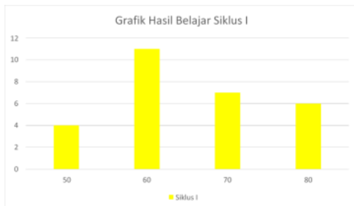
Gambar 3. Hasil belajar siklus 1

Dapat dilihat dari data grafik dan tabel 2 dapat dilihat bahwa pencapaian nilai siswa sudah mengalami peningkatan meskipun juga belum optimal. Dari 28 siswa kelas I, terdapat 15 siswa yang belum tuntas dimana mereka mendapat nilai pada rentang 40-60. Dalam 13 siswa memperoleh nilai 70-80.